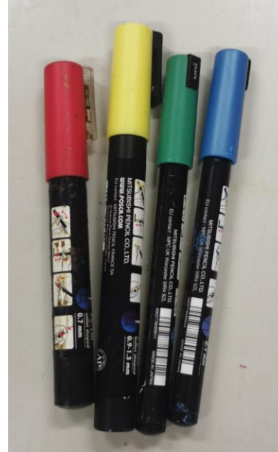
Cage à piston et feutres pour marquer une reine, Jade Laumain