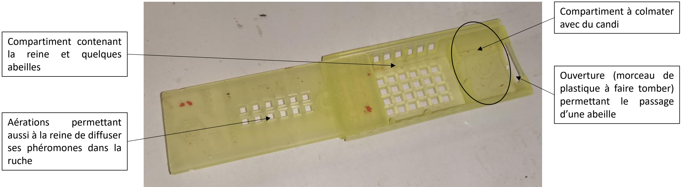
Caissette de transport et introduction pour reine et accompagnatrices, Jade Laumain

Une fois le candi grignoté par les abeilles de la ruche, la reine est libérée. La reine et les ouvrières ont aussi une ouverture permettant d'accéder au compartiment contenant du candi.