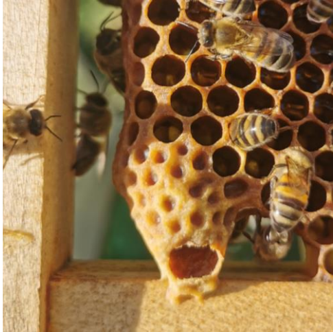
Cellule royale Jade Laumain