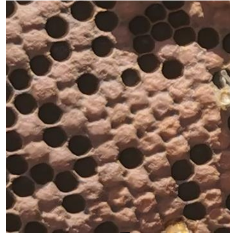
Cellules d'ouvrières Jade Laumain